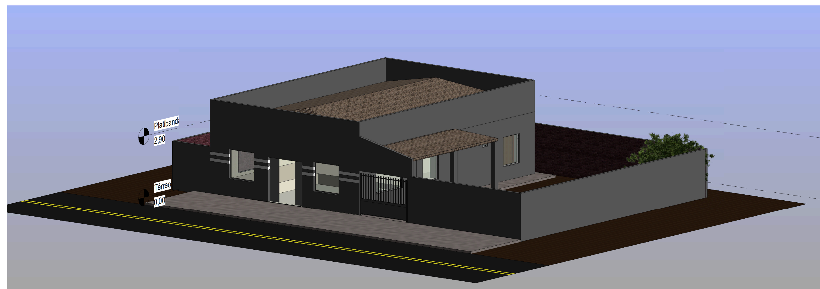
2 Vista 3D - Prédio Exterior