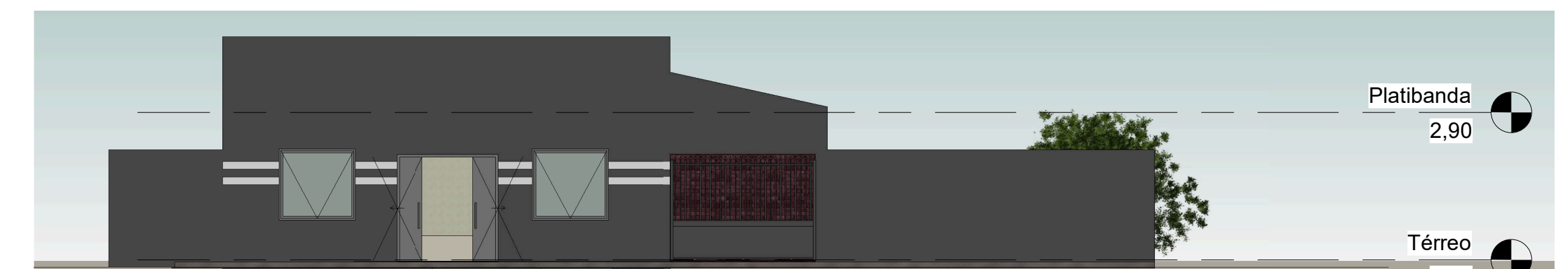
3 Frontal 1 : 100