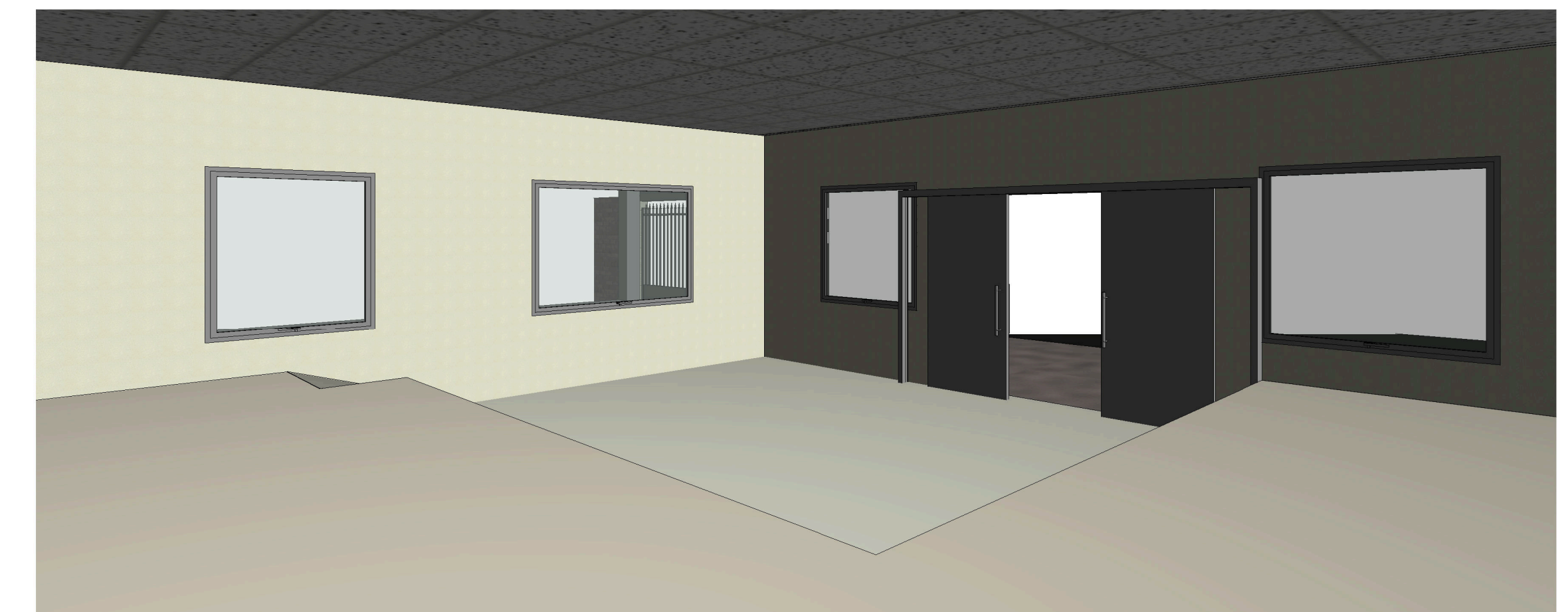
5 Vista 3D 2 - Plenário